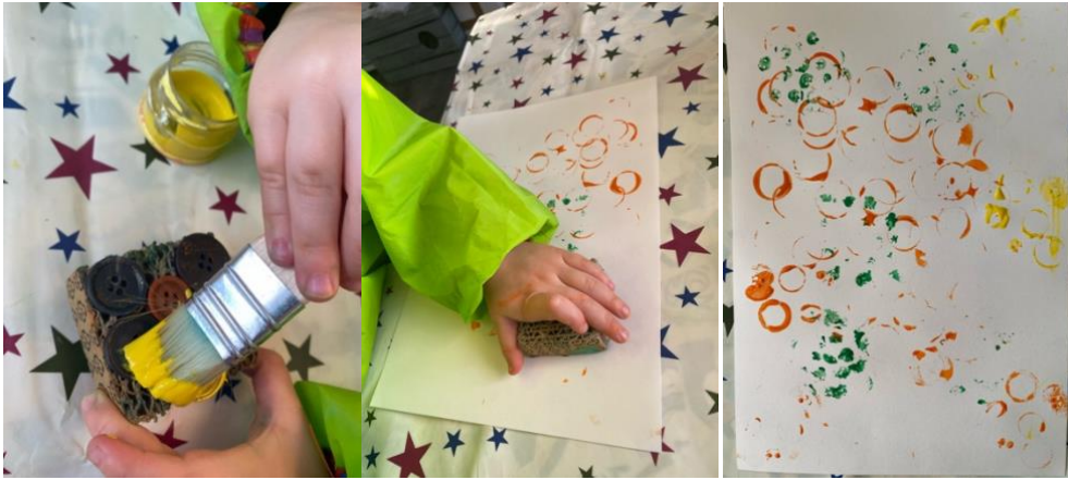
Micaella Cervinscaia und Jay (3 Jahre), wessen Hände ihr auf den Bildern seht